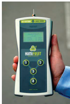
Contrôleur de taux d'humidité

Caractérisation diélectrique Micro-ondes Matériaux Modélisation électromagnétique Contrôle non destructif Thermique microondes