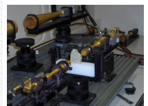
Caractérisation d'une Météorite à 100 GHz