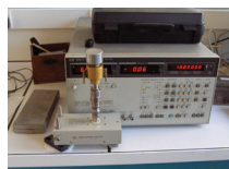
Mesures de permittivité analyseur d'impédance

La cellule A2M dispose de plusieurs analyseurs d'impédance de 10^{-2} Hz à 1,8 GHz et d' analyseurs de réseaux vectoriels de 10 MHz à 110 GHz, équipés de cellules de mesures ou de bancs d'antenne focalisés. Elle a également à sa disposition des outils de simulation électromagnétique et thermique (HFSS, XFDTD, ou code interne, ANSYS) sur des calculateurs scientifiques.